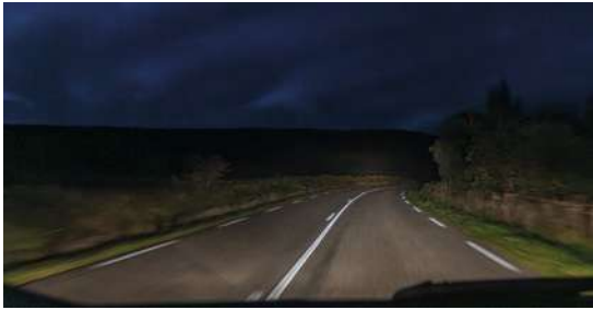
NUIT ARMORICAINE Association Pluie d'Images - CAPAB (Brest) Extérieurs de la Tour Tanguy (Square Pierre Péron) 8