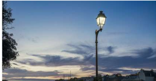
LA NUIT BOULEVERSÉE PAR L'HOMME OU PAR LA NATURE PERD SON MYSTÈRE L'œil du photographe (Le Faou) Mairie de quartier de Lambézellec 14