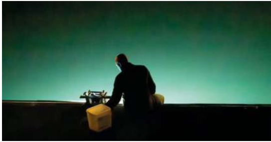
NUIT BLANCHE Grand Angle (Brest) Maison Pour Tous de Saint-Pierre 10