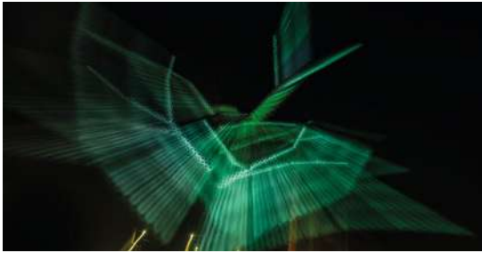
ON NOZ LE FLOU Atelier photo de Saint-Pierre (Brest) " Les Amarres " Centre social & Culturel Kéréderm 9