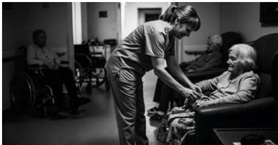
RETRAITE DE NUIT Jean-Yves Goujard Médiathèque Anjela Duval, Plougastel-Daoulas 6