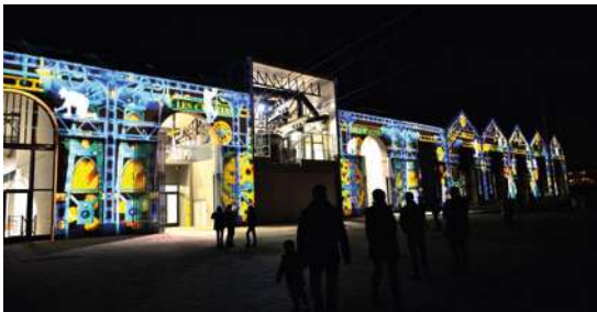
OBJECTIF NUIT PL Bergot (Brest) Cinéma l'Image (Plougastel-Daoulas) 16