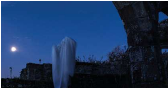
À L'HEURE BLEUE PhotoALL (Loperhet) Médiathèque des Quatre-Moulins 18