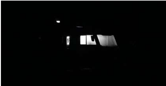
DU CRÉPUSCULE À L'AUBE Déclencheur (L'Hôpital-Camfrout) Maison de Quartier Lambézellec 12