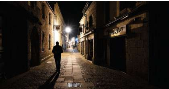
LE NOCTAMBLE Focale Iroise Elorn (Landerneau) BU Sciences - Le Bouguen 15