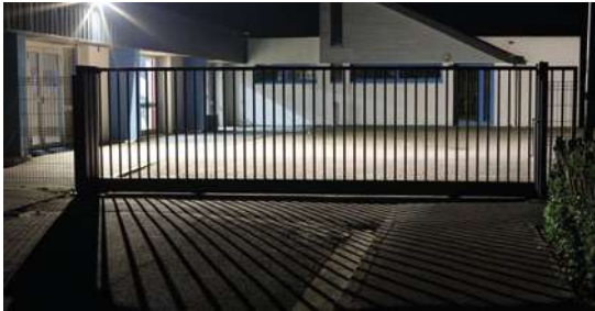
FOCALE NOCTURNE Photo-club Foyer Laique de Bourg-Blanc Médiathèque de Lambézellec 13