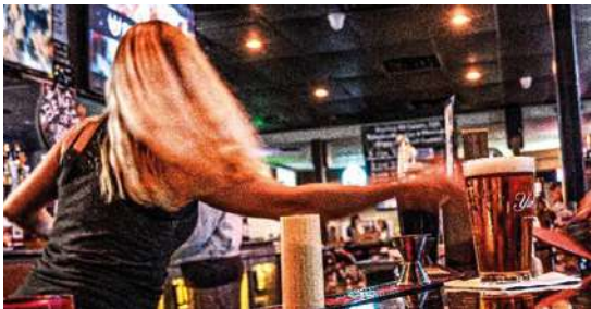
DANS LA NUIT DE LA NOUVELLE-ORLÉANS Jakes Balcon Mairie de quartier Europe 4