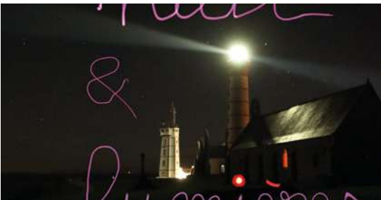
NUIT ET LUMIÈRES GAAEL (Locmaria-Plouzané) Le 204 19