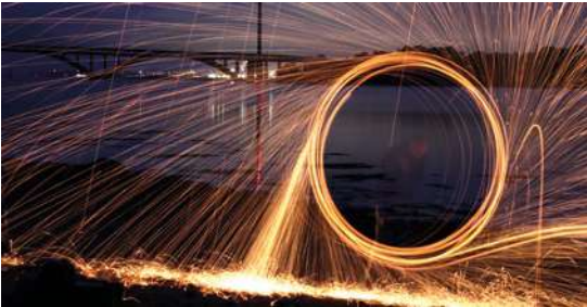
OSEZ LA FANTAISIE LA NUIT Foto'Gastel (Plougastel-Daoulas) Mairie du Relecq-Kerhuon 11