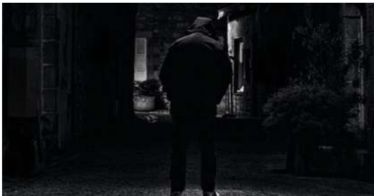
NOZ Landi Photo Club (Landivisiau) Mairie de Quartier des Quatre-Moulins 17