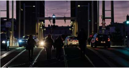
KÉR AN NOZ - LA VILLE, LA NUIT PhotoClub St Renan Médiathèque Jo Fourn Europe 7